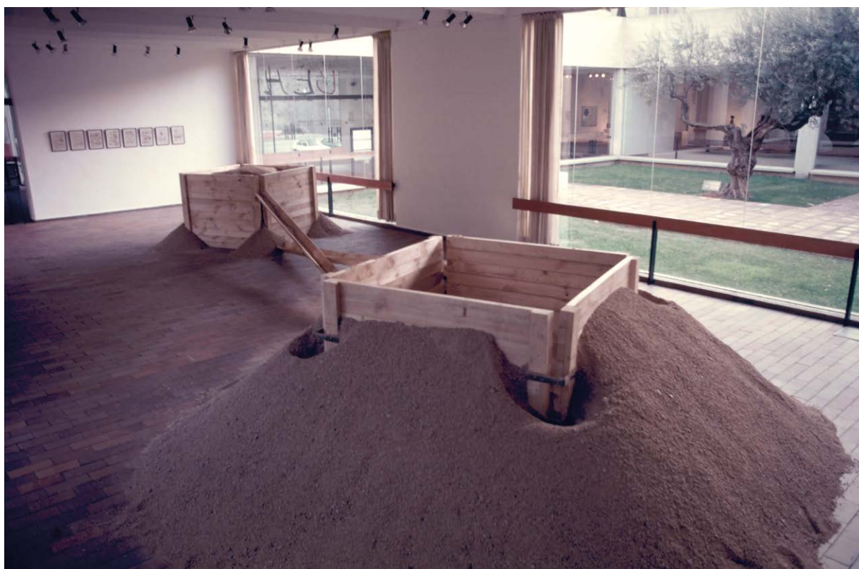
Eva Lootz, Arenas , 1986

Sus obras se encuentran en numerosas instituciones, museos y colecciones públicos y privados como el Museo Nacional Centro de Arte Reina Sofía, el Centro Galego de Arte Contemporánea, la Biblioteca Nacional o la Colección Unión Fenosa, y además han formado parte de numerosas exposiciones colectivas, tanto nacionales como internacionales, y han podido verse en repetidas ocasiones en ferias de arte internacionales como ARCO, FIA Caracas, Art Cologne, Art Basel (Basilea), KunstRAI (Ámsterdam), Art LA (Los Ángeles), Art Frankfurt, EXPO CHICAGO, etc.