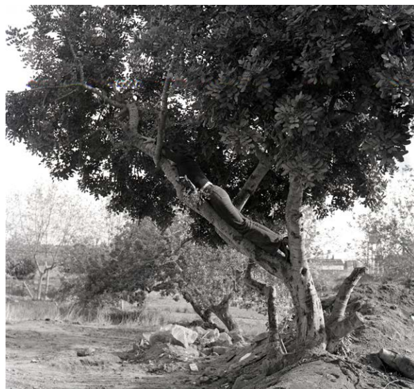
Fina Miralles, L'arbre. L'arbre i l'home. A dalt de l'arbre , 1975

Además, en el marco de la exposición, la Fundació presenta A la sombra de dos árboles , un proyecto de mediación artística creado por la artista Helena Laguna Bastante que ofrece una experiencia con el propósito de reflexionar sobre la historia del Espai 10 y su relación con el paisaje.