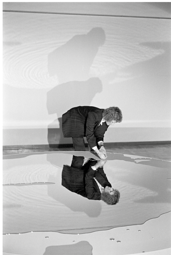
Eva Lootz, Metal , 1983

En aquellos años, el Espai 10 fue, junto con la Sala Vinçon y antes de la apertura de la Sala Montcada en 1981, un lugar único en Barcelona donde las artistas locales y de fuera se sintieron acogidas y respetadas. Un lugar donde pudieron crear, experimentar y descubrirse en libertad.