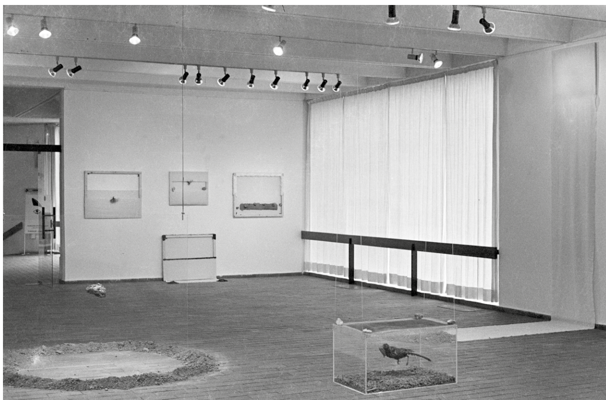
Fina Miralles, Paisatge , 1979

muestra, Miralles incluyó una serie de obras que, pese a aludir irónicamente a un género pictórico tradicional, eliminaban la representación y mostraban el artificio de la pintura a través de sus elementos constitutivos invisibilizados, tales como los bastidores de madera y el lienzo. Miralles intervenía en esas obras para incluir materiales extraídos directamente de la naturaleza y el paisaje, como piedras, plantas silvestres y tierra. También presentó piezas de carácter más instalativo que igualmente partían de un uso literal de los materiales del género paisajístico, entre ellas una «marina» que consistía en empapar un lienzo de líquido azul y dejar que el pigmento se absorbiera gradualmente hasta crear la ilusión de un horizonte marino.