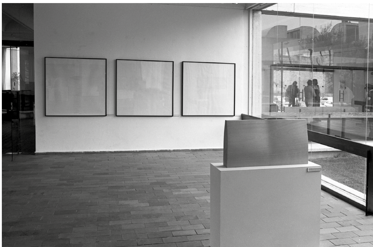
Susana Solano, Escultures i dibuixos , 1980

Desde los años ochenta, ha expuesto en numerosas galerías e instituciones como la Fundació Joan Miró de Barcelona (1980), el CAPC Musée d'Art Contemporain de Burdeos (1987), la Whitechapel Art Gallery de Londres (1993), el MEIAC de Badajoz (2004), la Fundación ICO de Madrid (2007), el Irish Museum of Modern Art (2011) y el IVAM de Valencia (2019), entre muchas otras, así como en certámenes internacionales como la Documenta de Kassel (1987 y 1992), la Bienal de São Paulo (1987) y la Bienal de Venecia (1988 y 1993). Su obra forma parte de colecciones como el Artium de Vitoria-Gasteiz, el Stedelijk Museum de Ámsterdam, el MoMA de Nueva York, la Fundación "la Caixa" de Barcelona, el Museo Nacional Centro de Arte Reina Sofía de Madrid y el MACBA de Barcelona.