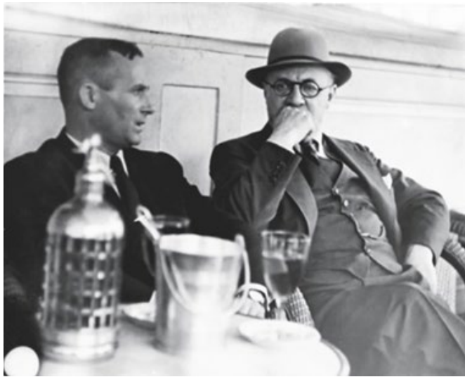
Joan Miró i Henri Matisse al cafè Les Deux Magots, París, c. 1936

Per la seva banda, Miró veia en Matisse una figura de referència en la seva recerca d'un llenguatge visual que combinés la brutalitat fauvista amb una poesia interior profunda. En les seves notes personals, Miró expressava el seu desig de crear obres que «tinguessin un esperit fauve però dins de la poesia», i que fossin fins i tot més «brutals» que les de Matisse. Aquesta connexió amb el fauvisme de Matisse va ajudar Miró a donar forma a la seva pròpia veu artística, marcada per una intensitat cromàtica i una energia vital que es van mantenir constants al llarg de la seva carrera.