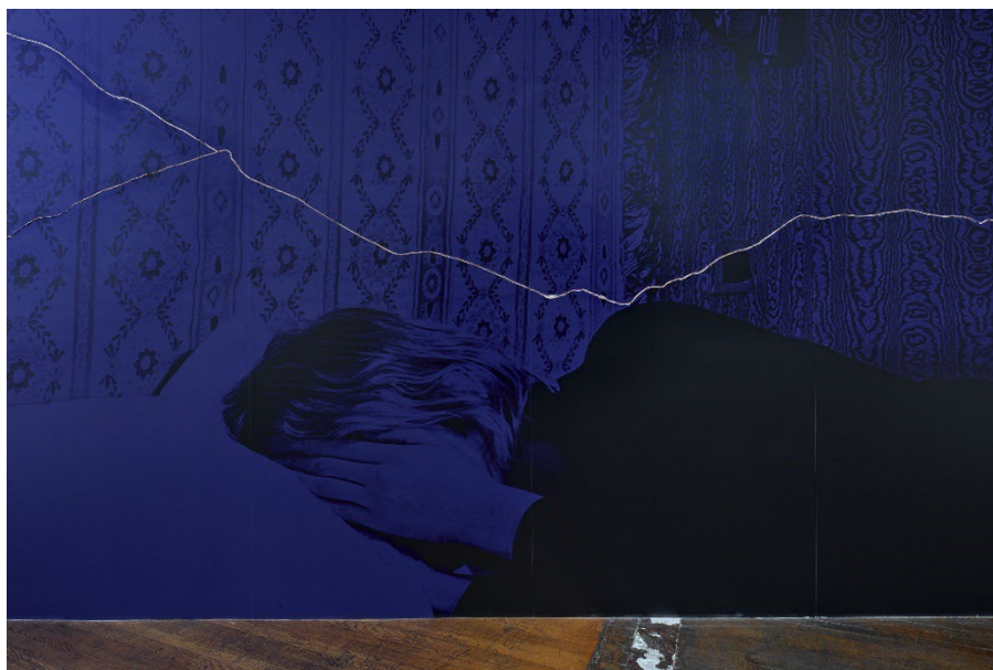
P. Staff, 2022. Cortesia de l'artista

P. Staff és poeta i artista, i en la seva pràctica visual utilitza mitjans com ara el vídeo, el collage, la instal·lació o el text. Els seus projectes exploren les maneres en què la història, la tecnologia, el capitalisme i la llei transformen la constitució dels cossos, prestant especial atenció al gènere, la crisi ecològica, la malaltia i la biopolítica. Li interessa la lectura com a canal de violència però també com a potencial de resistència, sobretot en relació amb la intimitat, l'abjecció i els efectes físics de la lectura.