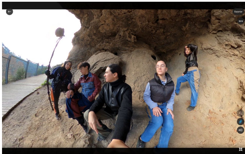
Bandolerismes , de Claudia Pagès. Cortesia de l'artista

El treball de Claudia Pagès aborda el text i els seus substrats materials des de diferents mitjans com ara l'escriptura, la performance, el vídeo o la instal·lació. Pagès extreu elements del llenguatge i els porta al terreny visual per contestar problemàtiques travessades per la lectura. Darrerament ha centrat la seva investigació artística en el gerundi. Per a l'artista, aquesta forma verbal emprada profusament en la redacció de textos policials i legals, així com en protocols que regeixen la logística internacional, té efectes directes sobre els espais i els cossos que es veuen afectats per ells.